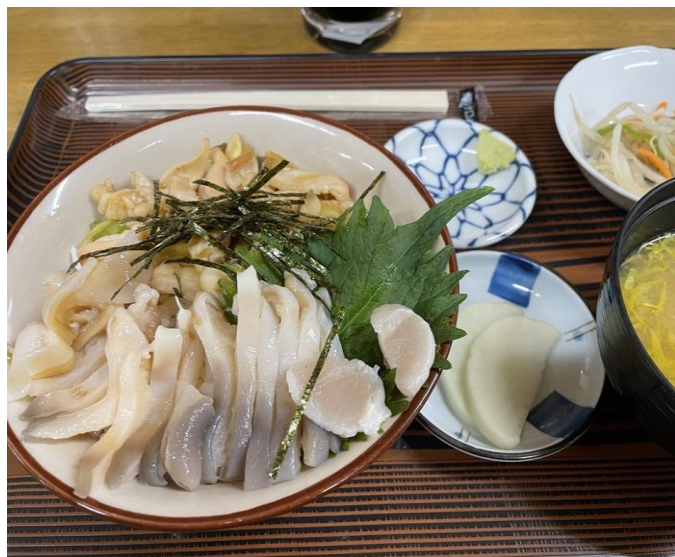
【生ホッキ】お刺身丼です、食感最高！