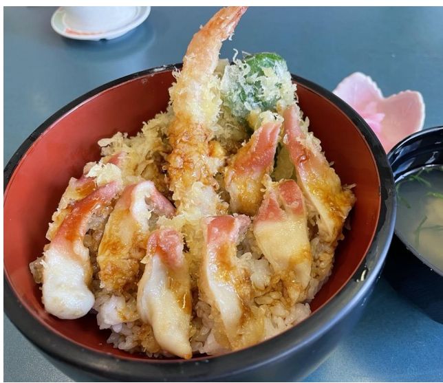
【天丼】天丼にしても美味！