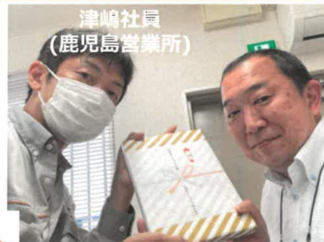
津嶋社員 (鹿児島営業所)

全国のAGCグループの配送車両に搭載されている三菱オートリース(MAL)様のドライブレコーダーは日々の安全運転をサポートしてくれる強力なツールですが、2021年度における“安全運転点数”が全国AGCの中で、我が社が極めて優秀であるとして、MAL様より年間全日100点運転を継続した3名に特別賞をいただきました。MAL様ありがとうございました。