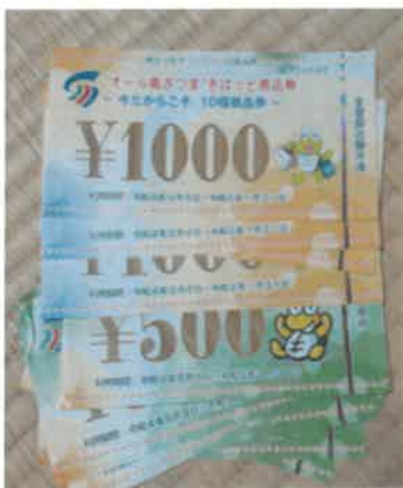
南さつま市…ありがとう！コロナ禍での経済活性化で、市民に2,000円で2万円分商品券販売！感謝するH社員。