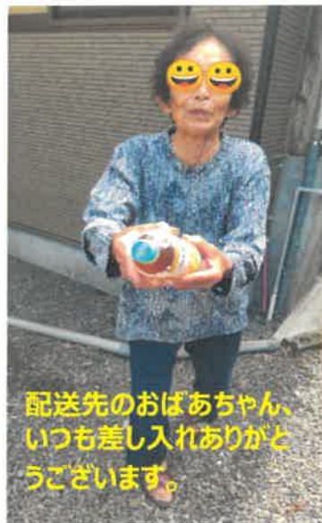
配送先のおばあちゃん、いつも差し入れありがとうございます。