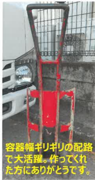
容器幅ギリギリの配路で大活躍。作ってくれた方にありがとうございます。

歳をとると、身体にガタが来ます。今では薬は命の源。医療関係者に感謝です…とF社員。