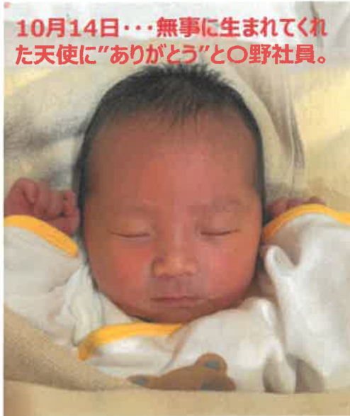
10月14日…無事に生まれてくれた天使に“ありがとう”と〇野社員。