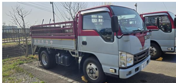
(左) 勅野産業マーキングの配送車両