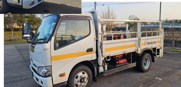
(右) 旧アストモガスセンター富山マーキングの配送車両

様々な工夫によってL Pガスの供給責任を果たしつつ、事故・怪我に遭わずに乗り切ることが出来ました。豪雨の後に猛暑到来。今年も異常な暑さが予測され、40℃を超える灼熱との戦いが続いています。