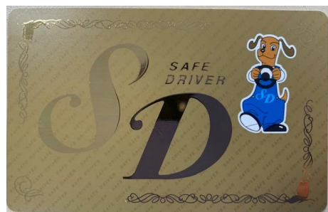
20年以上無事故無違反の証である“SDスーパーゴールドカード”

参加者全員に運転記録証明書、1年以上無事故無違反の参加者には安全運転者(Safe・Driver)の証であるSDカードが交付されます。このカードは無事故無違反の年数によって色分けされています。また、このカードを提示すると割引してくれる優遇店が多数あり、ガソリン代・食事代・宿泊代などが対象となっています。